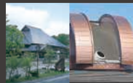
三瓶自然館サヒメル(車で10分)