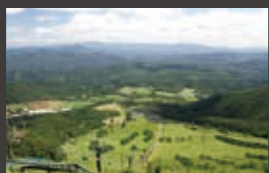
三瓶観光リフト(車で5分)