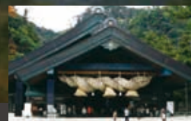
出雲大社神楽殿(車で1時間15分)